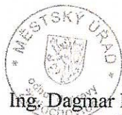
Ing. Dagmar Kratochvílová pověřena vedením odboru dopravy

Proti opatření obecné povahy, na základě ustanovení § 173 odst. 2 SŘ, nelze podat opravný prostředek. Soulad opatření obecné povahy s právními předpisy lze dle ustanovení § 174 odst. 2 posoudit v přezkumném řízení.